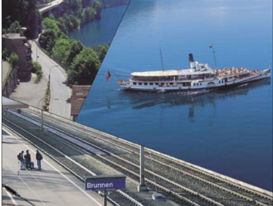
Axenstrasse / Schiff

Welches Verkehrsmittel bevorzugen Sie heute? Nach Zürich fährt jede halbe Stunde ein Zug – perfekt!